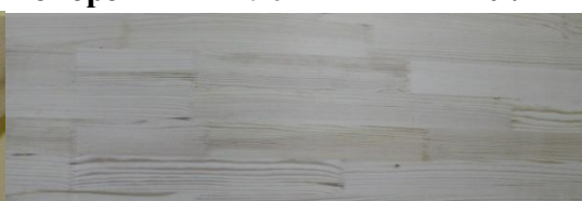
Ступень Сорт А сращенная