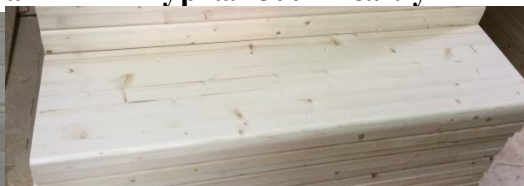
ступень сорт АВ