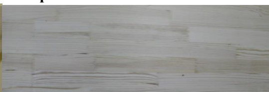
Ступень Сорт А сращенная